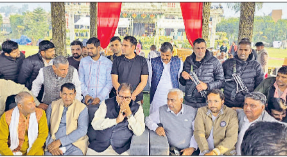
सोनीपत। कार्यक्रम में पहुंचे इनेलो के राष्ट्रीय अध्यक्ष अभय चौटाला।

हरिभूमि न्यूज ►► सोनीपत इंडियन नेशनल लोकदल के राष्ट्रीय अध्यक्ष अभय सिंह चौटाला शहर के गीतांजलि गार्डन में एक शादी समारोह में पहुंचे। चौटाला ने कहा भाजपा सरकार लगातार जनविरोधी फैसले लेकर हरियाणा प्रदेश को पूरी तरह से बर्बाद करने पर तुली है। आज प्रदेश में चारों ओर हाहाकार मचा है। भाजपा ने किसान विरोधी फैसले लेकर किसानों को बर्बाद किया। युवा विरोधी फैसले लेकर युवाओं को सरकारी नौकरी के लिए तृसा दिया। दिव्यंग विरोधी फैसले लेकर उनकी रिटायरमेंट की उम्र को 60 साल से घटाकर 58 साल कर दिया। भाजपा सरकार अब बुजुर्गों को भी नहीं बख्शा रही और बुजुर्गों के सम्मान के लिए दी जाने वाली बुढ़ापा पेंशन को आय से जोड़ने के साथ साथ अन्य कई शर्तें लगाकर काट रही है। अभय चौटाला ने कहा कि यह हमारे प्रदेश का दुर्भाग्य है कि पिछले ग्यारह साल से जनविरोधी