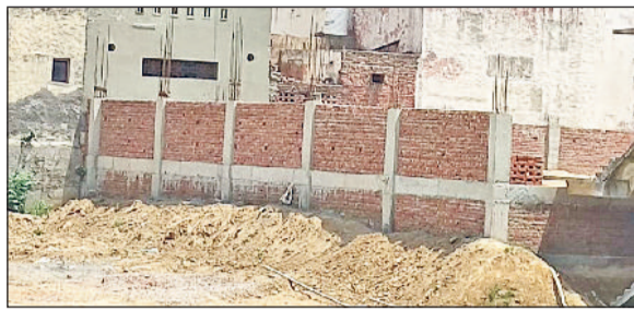
सोनीपत। सोनीपत के गोहाना रोड स्थित सुभाष स्टेडियम में बजट के अभाव में अघर में लटकी निर्माणाधीन शूटिंग रेज।

शहर में 25 मीटर शूटिंग रेज का निर्माण जल्द पूरा होने की आस लगाए बैठे निशानेबाजों को बड़ा झटका लग सकता है। गोहाना रोड स्थित सुभाष स्टेडियम में वर्ष 2025 से निर्माणाधीन 25 मीटर शूटिंग रेज के निर्माण में अचानक बदलाव किए जाने का निर्णय लिया गया है। करीब माह पूर्व उपायुक्त ने निरीक्षण के पश्चात उक्त जमीन पर मल्टीपर्पज हॉल का निर्माण करवाने के निर्देश दिए हैं, ताकि हॉल को विभिन्न खेलों के प्रयोग में लाया जा सके। खिलाड़ियों को एक जगह सुविधा मिल सके। साथ ही नगर निगम व खेल विभाग को जल्द बजट तैयार करने के निर्देश दिए गए हैं। नगर